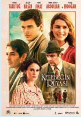
KELEBEĞİN RÜYASI Yer: Anadolu Salonu Saat: 14:00