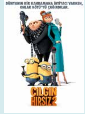
ÇILGIN HIRSIZ 2 Yer: Akdeniz Salonu Saat: 14:00