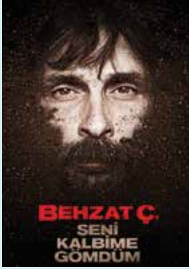
BEHZAT Ç. SENİ KALBİME GÖMDÜM Yer: Anadolu Salonu Saat: 11:00