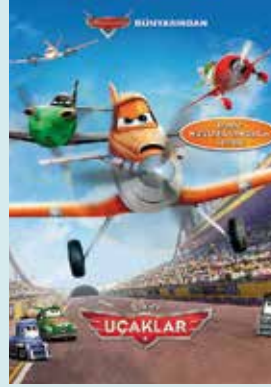
UÇAKLAR Yer: Akdeniz Salonu Saat: 11:00