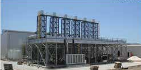
TİRENDA DOĞALGAZ CEVRİM SANTRALİ