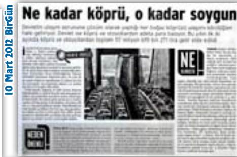
Mart 2012 Anba Rapor