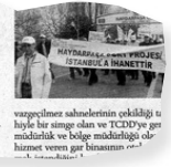
Haydarpaşa Garı'nın çekildiği tiyatro bir simge olan ve TCDD'ye getirdiği hizmet veren gar binasının...