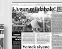
13.05.2013 Yangın ve Güvenlik Dergisi