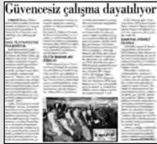
16.03.2013 Evrensel Gazetesi