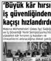
17.03.2013 Birgün Gazetesi