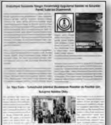
25.06.2013 Yangın ve Güvenlik Dergisi