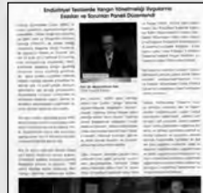
25.03.2013 Yangın ve Güvenlik Dergisi