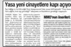
31.03.2013 Sol Gazetesi