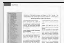
18.06.2013 Sektörel haber