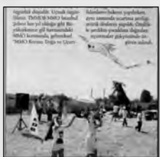
14.05.2013 Gündem Gazetesi