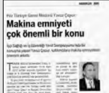
18.05.2013 Makina Magazin