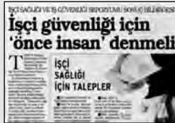
01.04.2013 Evrensel Gazetesi