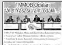
27.03.2013 Ataşehir Haberci