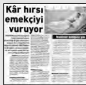
17.03.2013 Özgür Gündem Gaz.