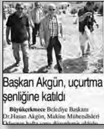
16.05.2013 Büyükçekmece Gazetesi