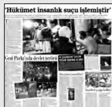
17.06.2013 Evrensel Gazetesi