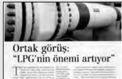
21.05.2013 Global Enerji Derg.