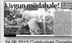
24.06.2013 Cumhuriyet Gazetesi