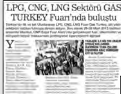
25.06.2013 Habertürk Gazetesi