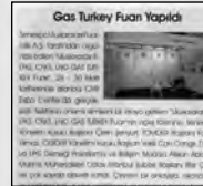
13.05.2013 Yangın ve Güvenlik Dergisi