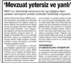
16.03.2013 Sol Gazetesi