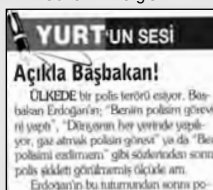
25.06.2013 Makina Magazin