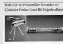
25.05.2013 Endüstri Otomasyon Dergisi