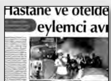
27.03.2013 Ataşehir Haberci