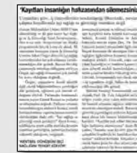
17.03.2013 Sol Gazetesi