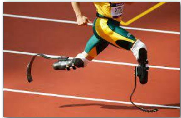
Karbon Fiber Kompozit Malzemelerin Protezlerde Kullanımı