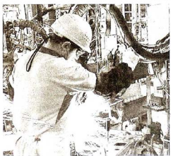
Sanayide yatırımların payının 2015'te 6 puan birden geldiği bildirildi.

TMMOB Makine Mühendisleri Odası (MMO), her yıl düzenlenen 'Sanayiye Yatırımların Durumu' raporunu yayımladı. Raporun özetinde, imalat sektöründe yatırımların payının 2015'te 6 puan birden geldiği bildirildi.