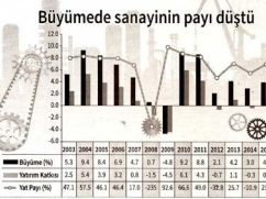
Büyümede sanayinin payı düştü

Türkiye'nin 2015'te 107 milyar 200 milyon TL'ye ulaşan toplam yatırımların içinde imalat sanayinin payının 2015'te 29,1'e gerilediği bildirildi. 2012-2015 yılları arasında imalat sanayinin yatırımlarının toplam tutarı 2014'e göre %10,3 artmıştır.