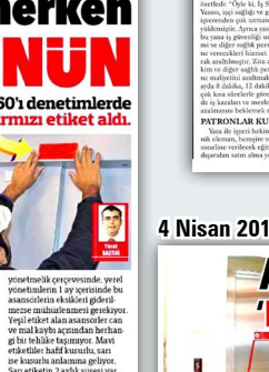
Türkiye'deki asansörlerin yüzde 60'ı denetimlerle 'kullanılmamaz' anlamına gelen kırmızı etiket aldı.